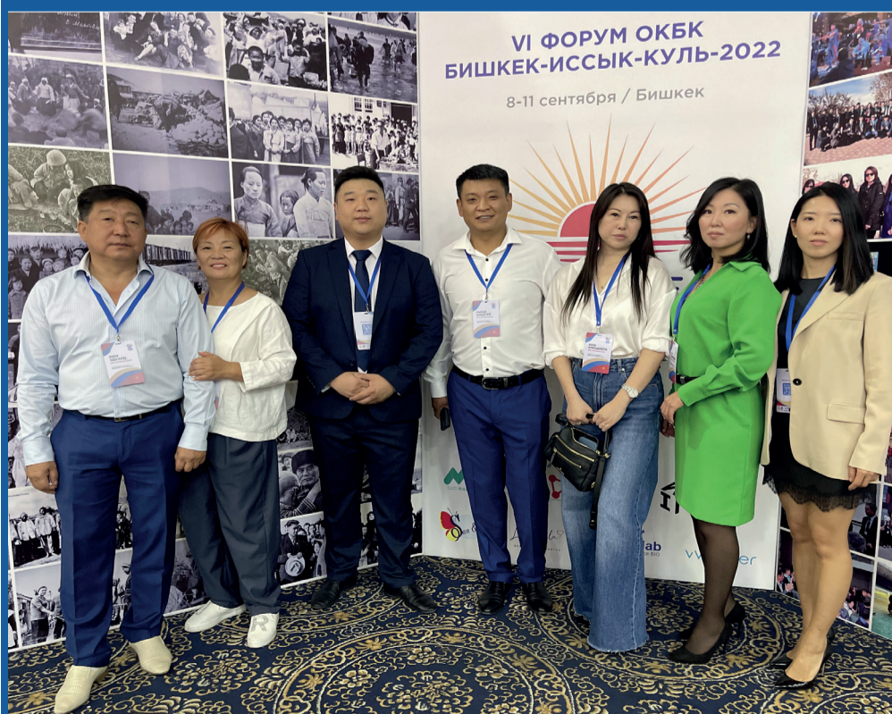
Делегация КБК «Дон» на VI форуме ОКБК в Бишкеке

Основан 9.07.2022 года. Основная миссия клуба — создать сообщество для общения и нетворкинга. Усилить, развить конкурентные преимущества за счет объединения людей, как опытных бизнесменов, которые хотят укрепить и усовершенствовать свой бизнес, так и начинающих предпринимателей, а также для поддержки и популяризации корейской культуры в регионе. Резидентами сообщества являются предприниматели, бизнесмены, топ-менеджеры и маркетологи. Встречи, на которых можно поделиться мнением или получить экспертизу, обсудить стратегические и операционные вопросы, способствуют качественному расширению деятельности. Стимулируя и вовлекая единомышленников, соперничая и радуясь достижениям, резиденты Корейского Бизнес Клуба понимают, что у них намного больше общего.