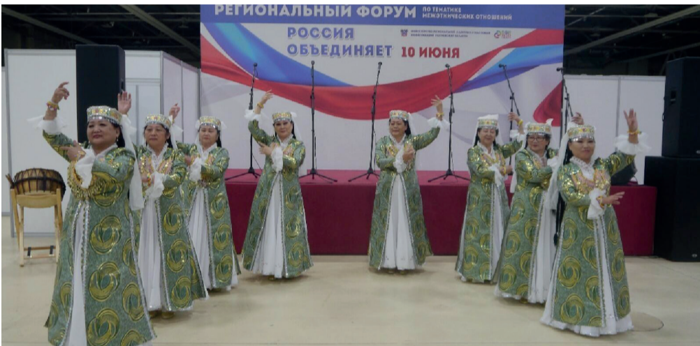
Вокально - хореографический ансамбль «Ариран»